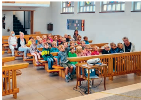
Die Schüler aus Zuckenriet freuen sich auf das neue Schuljahr.

In insgesamt sechs verschiedenen Gottesdiensten in der ganzen Seelsorgeeinheit wurde das neue Schuljahr unter den Segen Gottes gestellt. Wir wünschen allen Schülerinnen und Schülern ein gelingendes, gesegnetes neues Schuljahr.