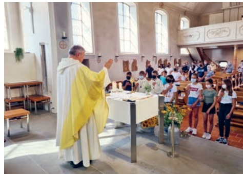
Auch im Gottesdienst in Lenggenwil wurden die neuen Oberstufenschüler gesegnet.