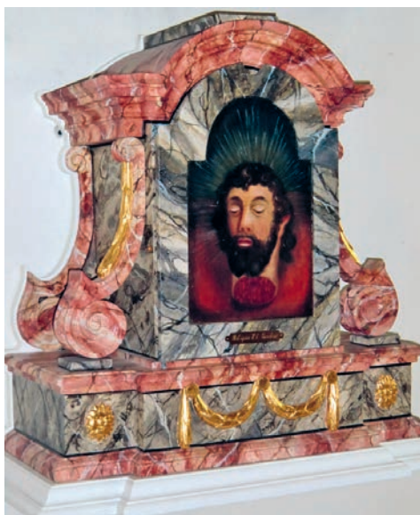
Reliquiar in der Kirche Brederis bei Rankweil

ihm Rat, Trost und Hilfe. Vehement setzte er sich gegen die Sonntagsarbeit ein und schaffte sich dadurch Feinde. Seine Gegner schlugen ihm mit Sensen das Haupt ab. Er starb im Jahre 884 und wurde auf dem Viktorsberg beigesetzt. Ein Teil seiner Reliquien wurden 1786 in die neu erbaute Kathedrale St. Gallen übertragen.