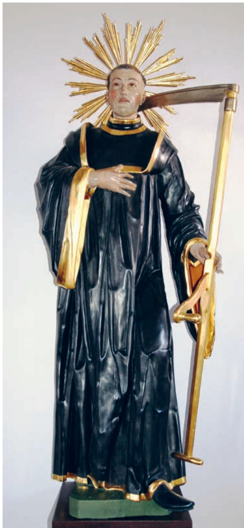
Eusebiusstatue in der Kirche Niederwil. Eusebius trägt die Sense, mit der er umgebracht wurde.

Eusebius kam als irischer Benediktinermönch ins Kloster St. Gallen, wo er mehrere Jahre lebte. Er zog sich dann zurück und führte 30 Jahre lang ein Leben als Einsiedler auf dem Vogelsberg – heute Viktorsberg genannt – bei Rankweil, pflegte und heilte Kranke und verkündete das Evangelium.