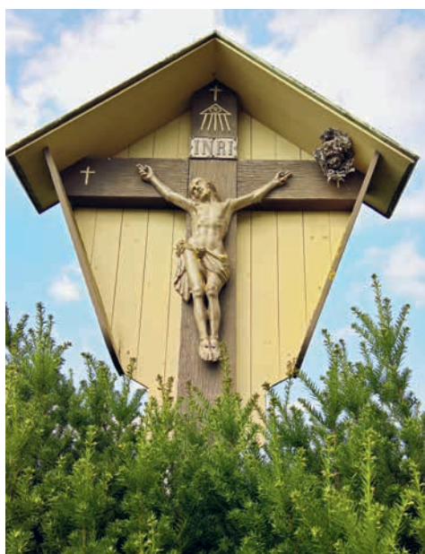
Gaisberg, Niederbüren (vor der Restauration)