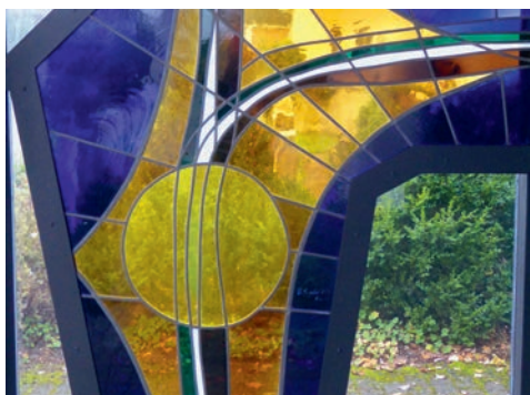
Glaswand der Abdankungshalle Oberbüren