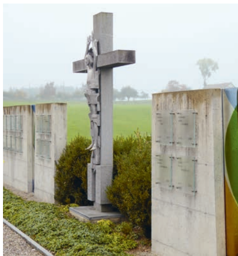
Kreuz bei der Urnenwand Niederwil